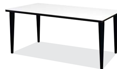
スノーホワイト色 (W)