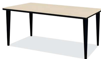
クレマベージュ色 (B)