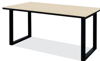
クレマベージュ色 (B)