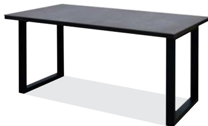
アイアングレイ色 (R)