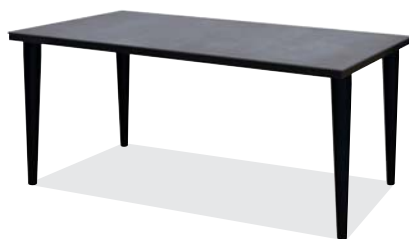
アイアングレイ色 (R)